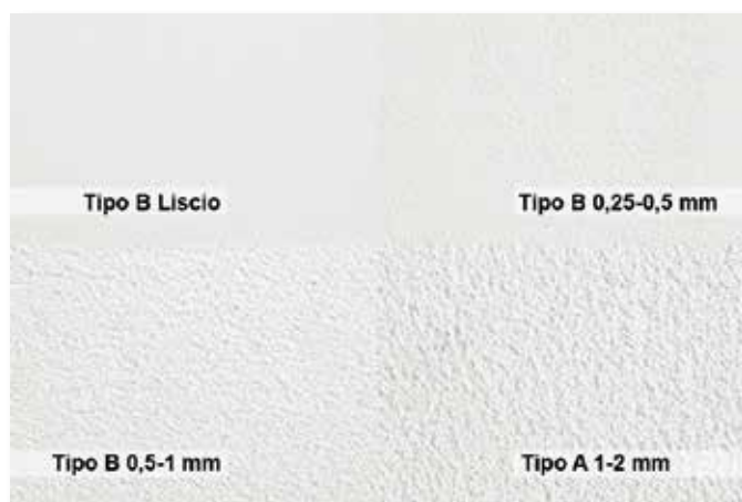
Granulometria delle varie finiture